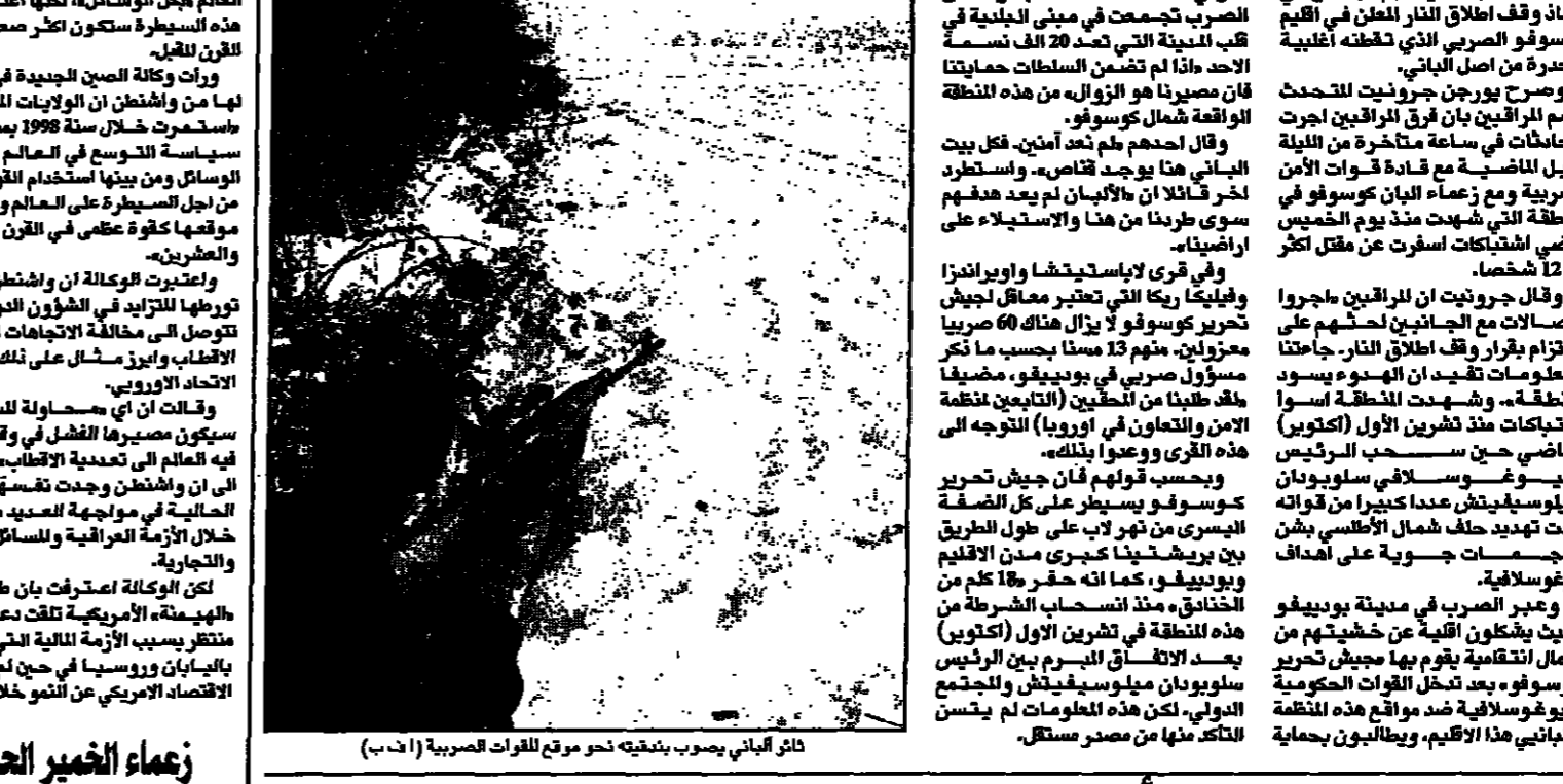
قات ألباني يصوب بنادقه نحو مقر لواء الصربية